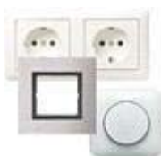
Jung schakel materiaal