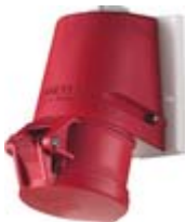
Perilex- en CEE contactdozen