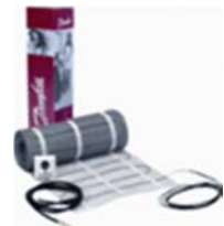
Spiegel- & vloerverwarming